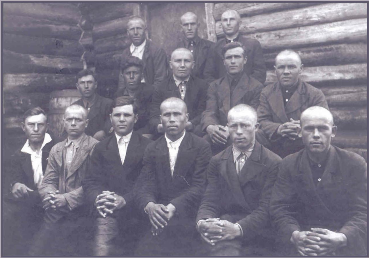
Призыв 1942 года